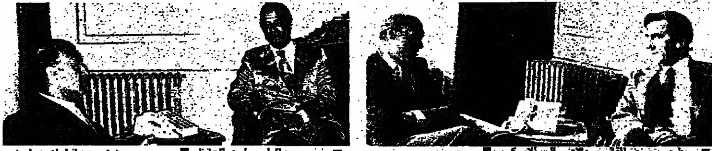
... ومع الرئيس أمين الحافظ

استقبل السيد زؤاد بطرس وزير الخارجية قبل ظهر امس على التوالي كلاً من: الوفد الصحفي الألماني، والوفد الصحفي الهنلي الذي يرأسه السيد الدكتور جوردن، والسيد جورج لين القائم بالأعمال السفارة الأميركية في بيروت لمدة ٢٥ دقيقة، الذي قال بعد لقائه: